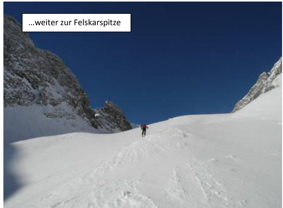
...weiter zur Felskarspitze