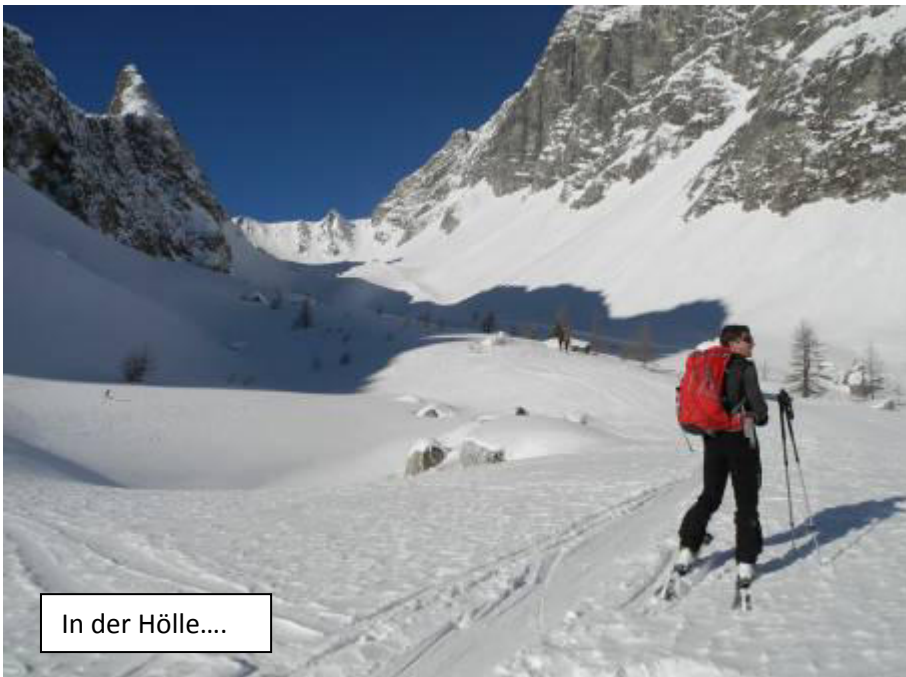
In der Hölle...