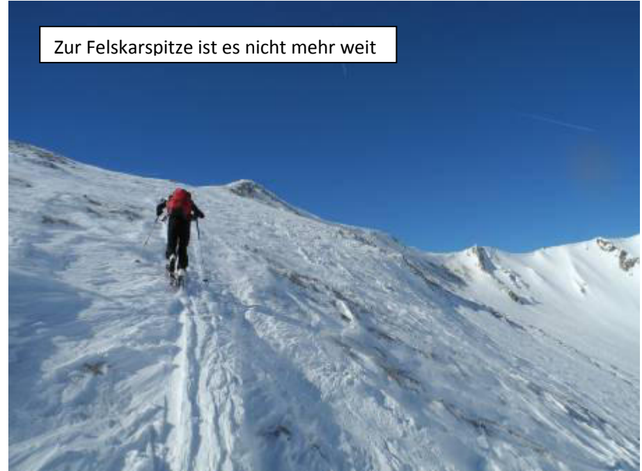
Zur Felskarspitze ist es nicht mehr weit