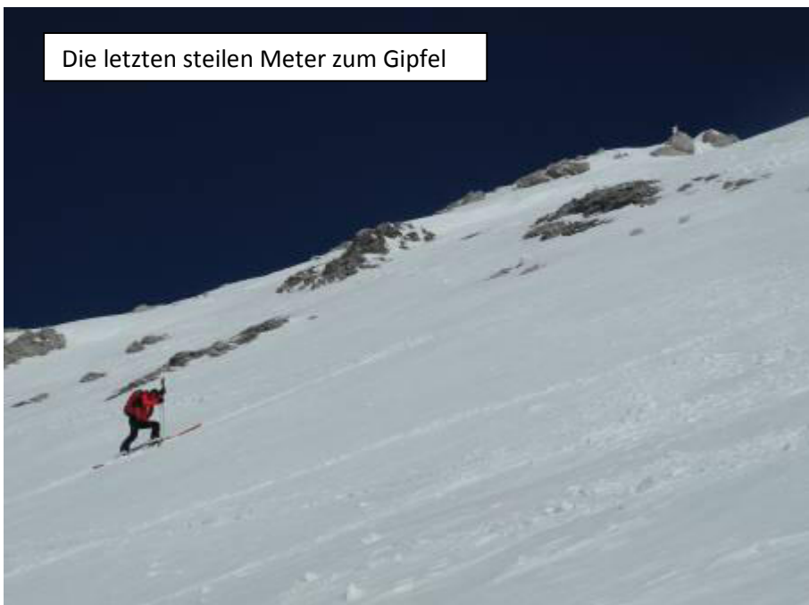
Die letzten steilen Meter zum Gipfel