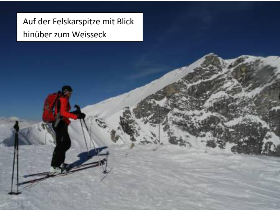
Auf der Felskarspitze mit Blick hinüber zum Weisseck