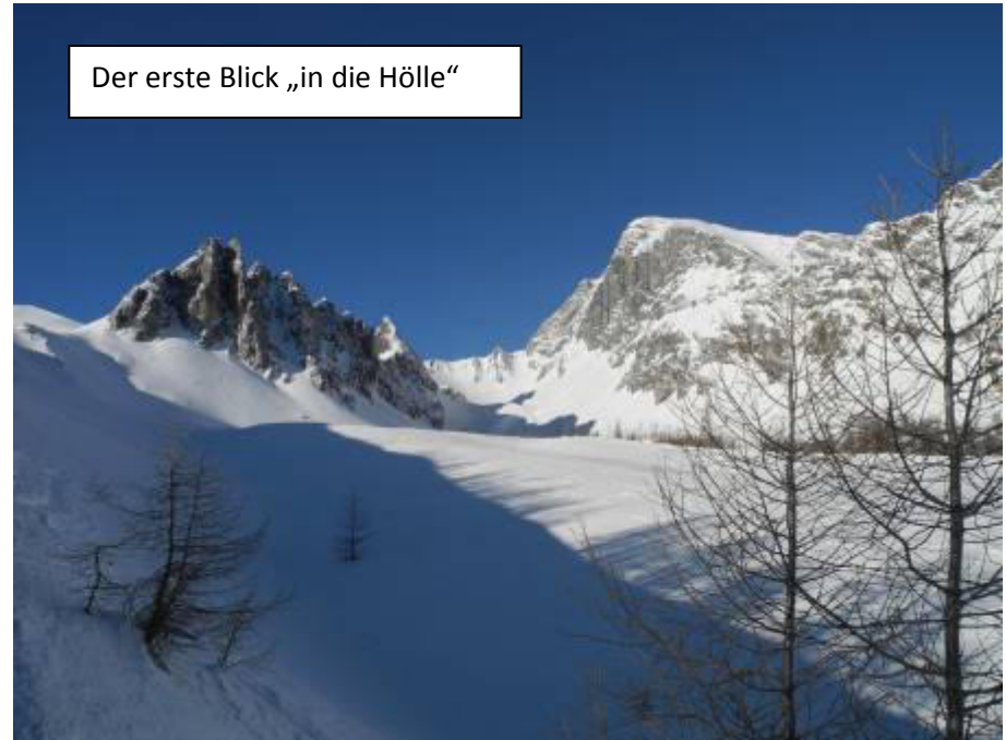
Der erste Blick „in die Hölle“