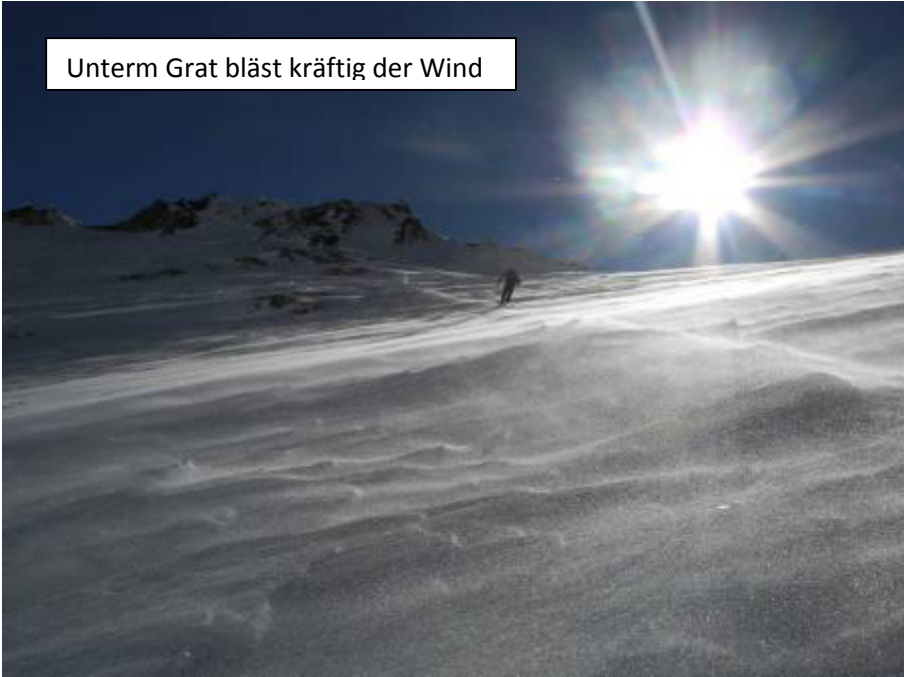
Unterm Grat bläst kräftig der Wind