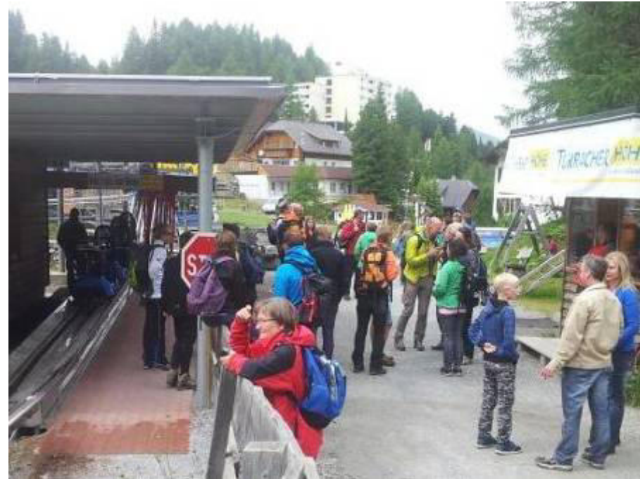
.....Fahrspaß mit den „Nockyflitzern“ für jede Generation....