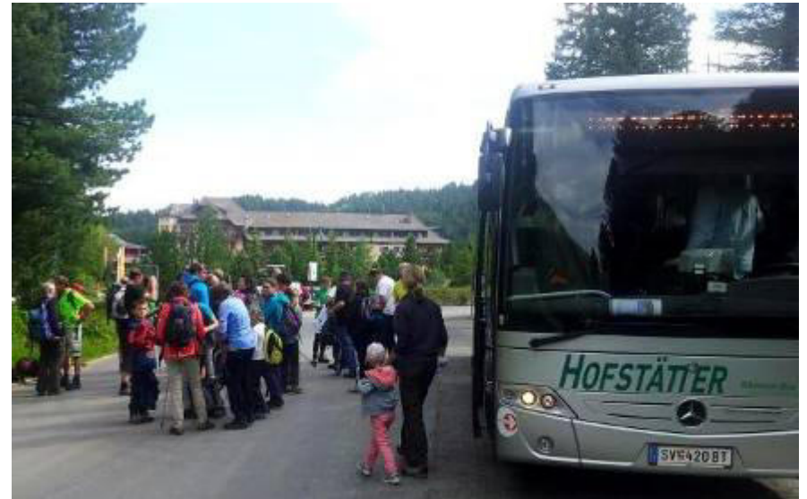
.....Ankunft auf der Turrach.....