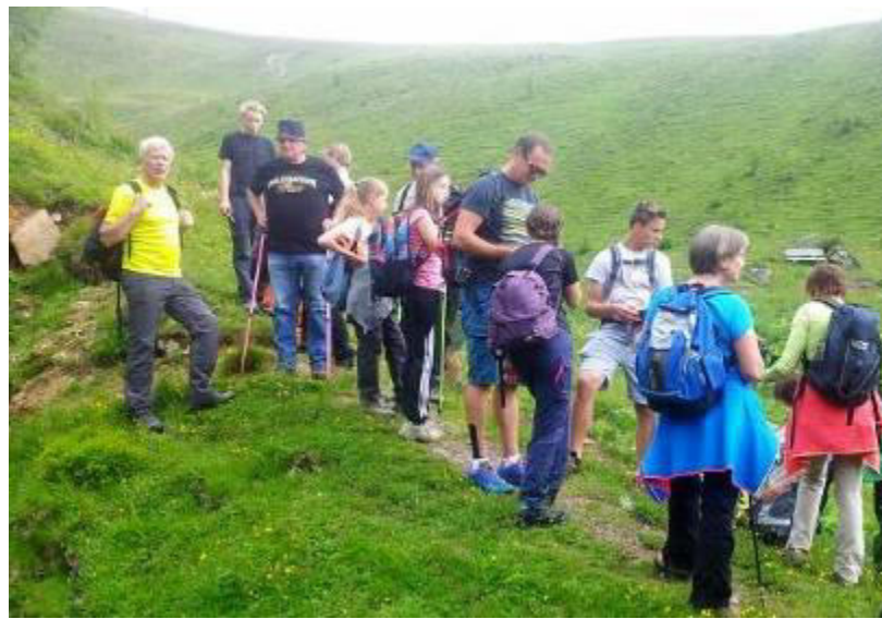
.....wo gehts weiter.....