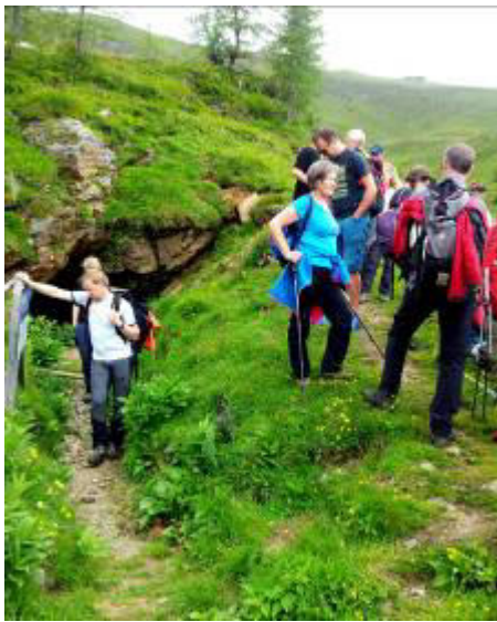
.....Rast beim Stollen.....