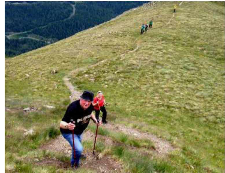
.....nicht mehr weit zum Gipfel.....