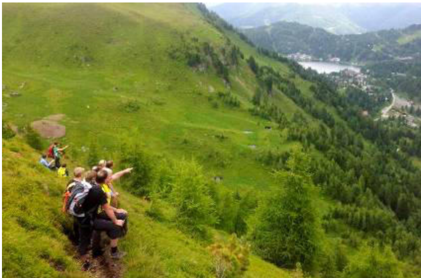
.....Blick zurück auf die Turracher Höhe.....