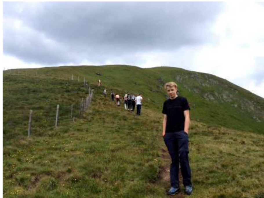
.....wo sind die anderen.....