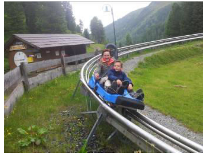
.....wer hat mehr Mut....