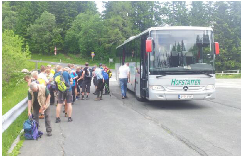
.....Ankunft Parkplatz Klippitztl.....