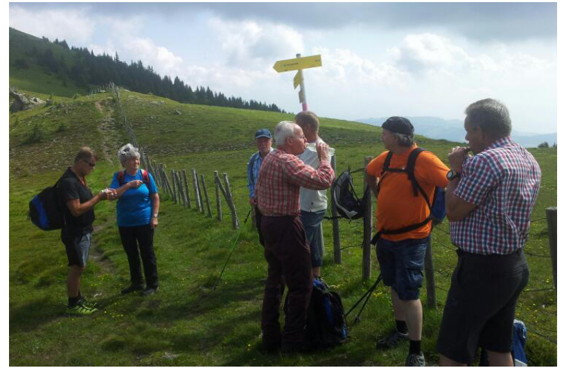
....Rast zwischen Geierkogel und Steinerne Hochzeit....