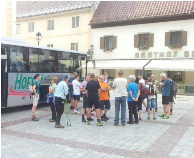
.....Zusammenkunft am Hauptplatz.....

Zusammenfassung: Stimmungsvolle Wanderung bei schönem Wetter. Ab 13 Uhr 30 Zusammenkunft der einzelnen Gruppen bei der Naturfreunde Hütte am Klippitztörl zur allgemeinen Stärkung. Erfreuliche Bewirtung auf der Hütte! Wetterglück – nach der allgemeinen Stärkung - ein heftiges Gewitter am Klippitztörl !