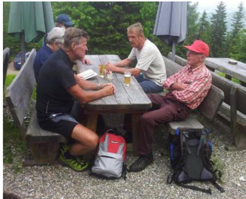
.....Stärkung bei der „Naturfrende Hütte“....