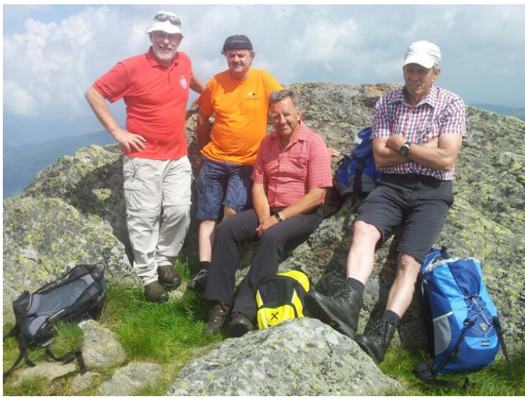
.....auf der „Steinernen Hochzeit“.....