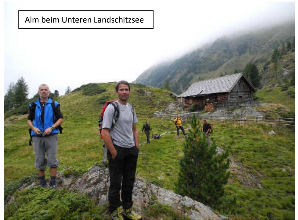
Alm beim Unteren Landschitzsee