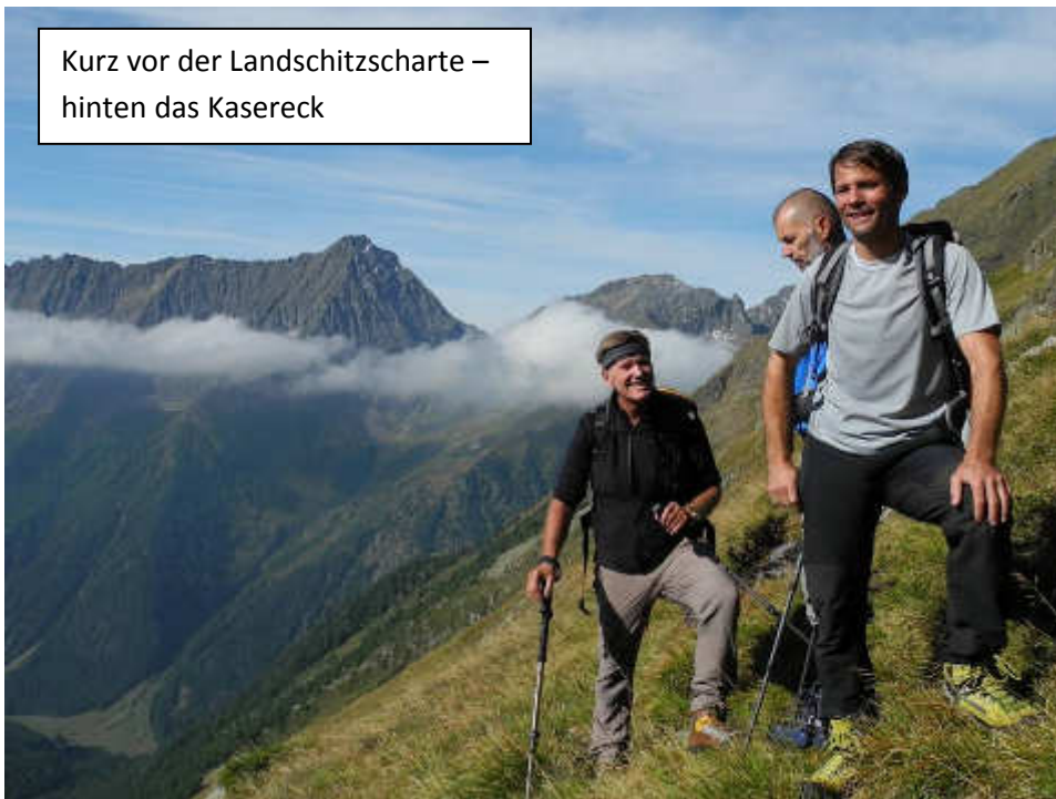
Kurz vor der Landschitzscharte – hinten das Kasereck