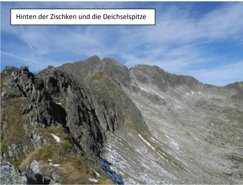
Hinten der Zischken und die Deichselspitze