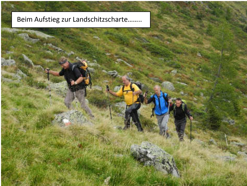
Beim Aufstieg zur Landschitzcharte.....