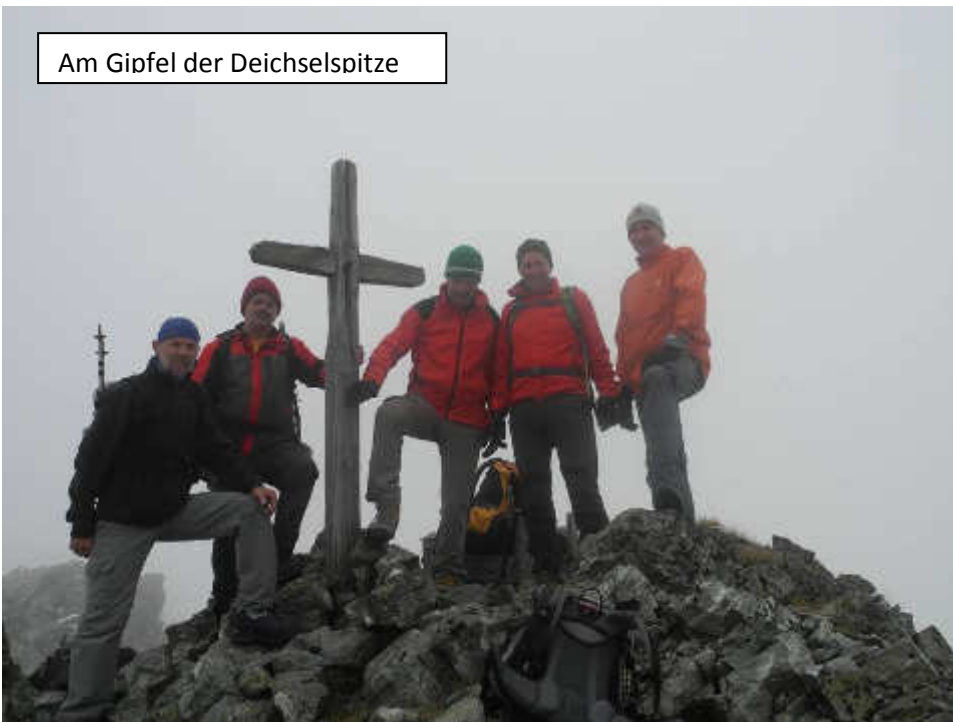
Am Gipfel der Deichselspitze