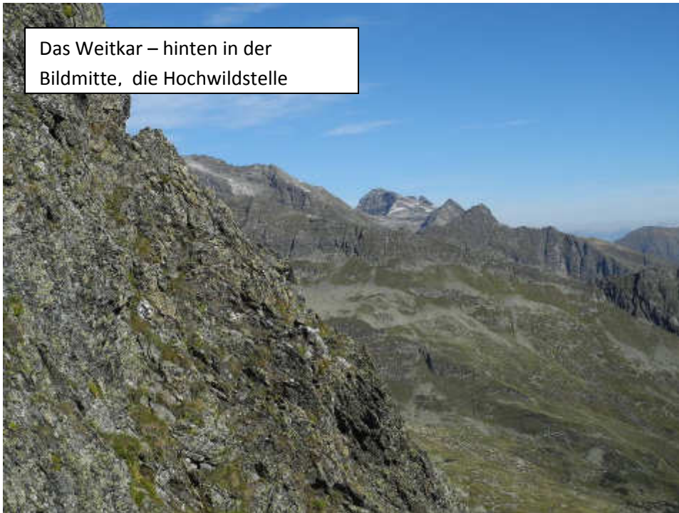
Das Weitkar – hinten in der Bildmitte, die Hochwildstelle