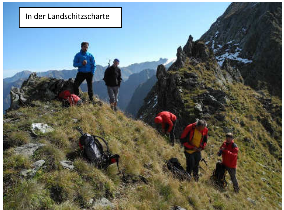
In der Landschitzscharte