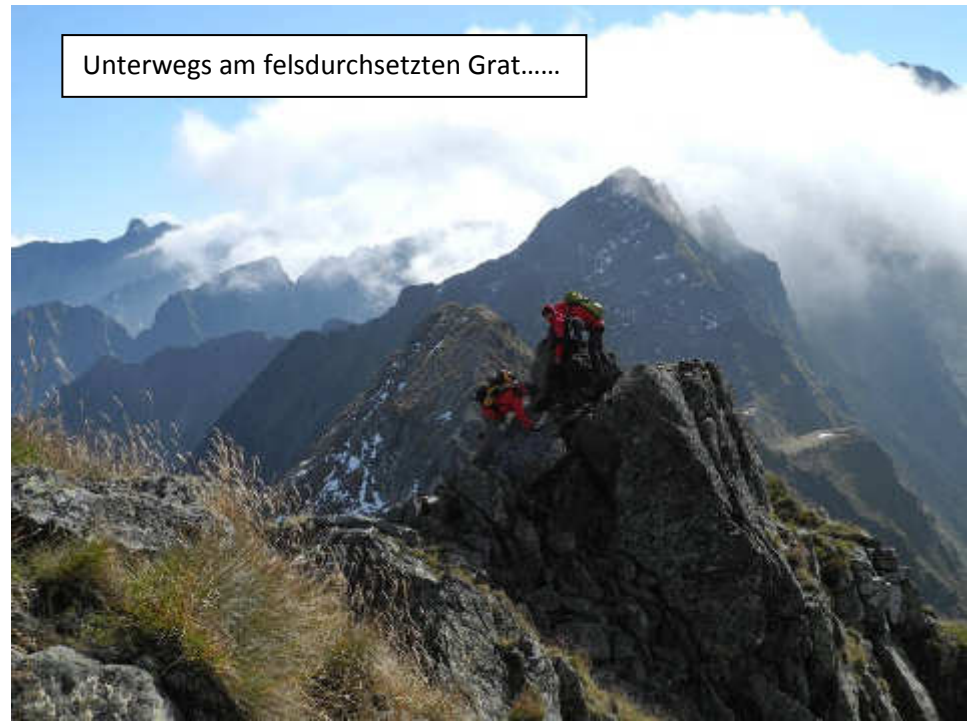
Unterwegs am felsdurchsetzten Grat.....