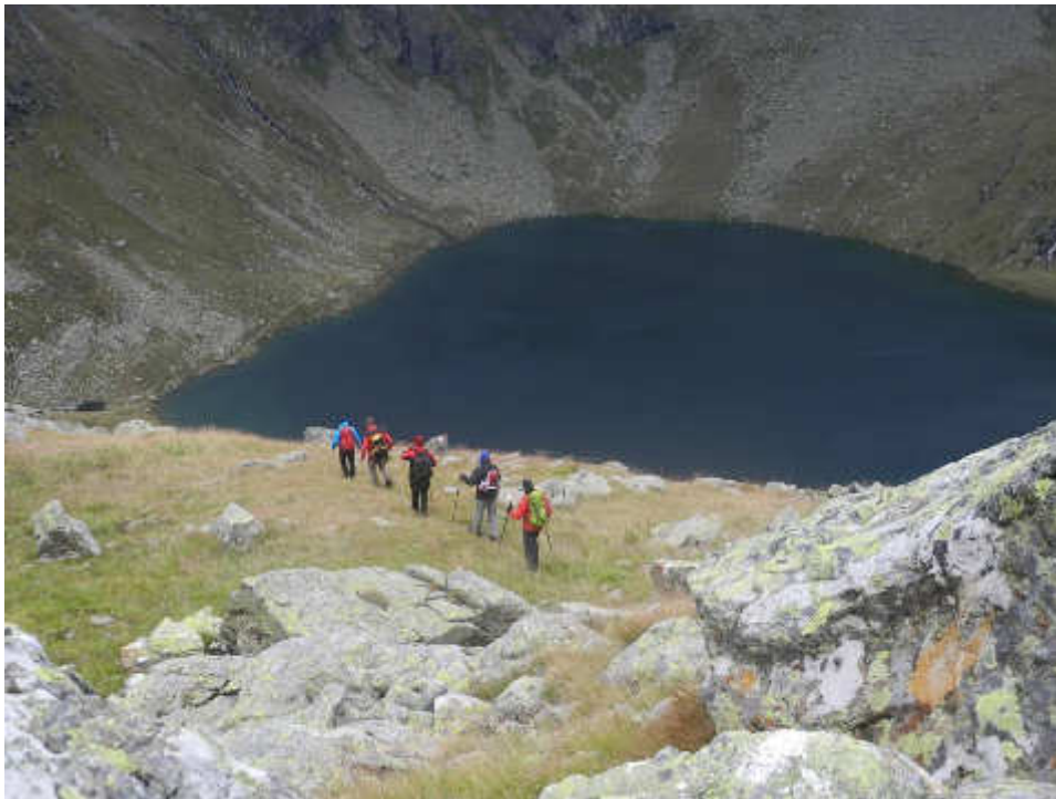
Zurück zur Laßhoferalm