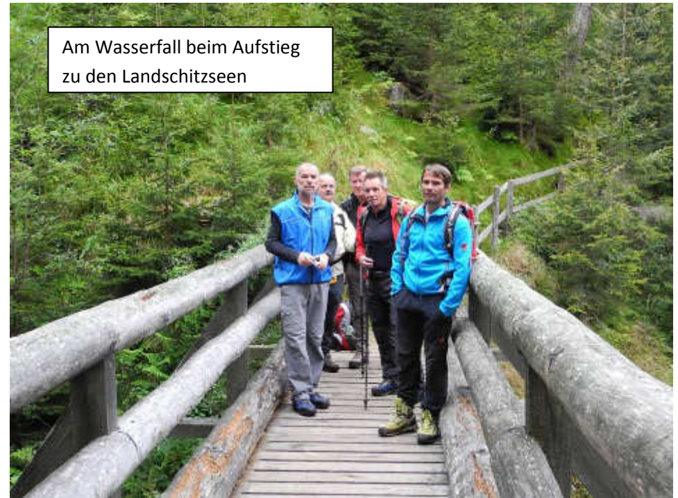
Am Wasserfall beim Aufstieg zu den Landschitzseen