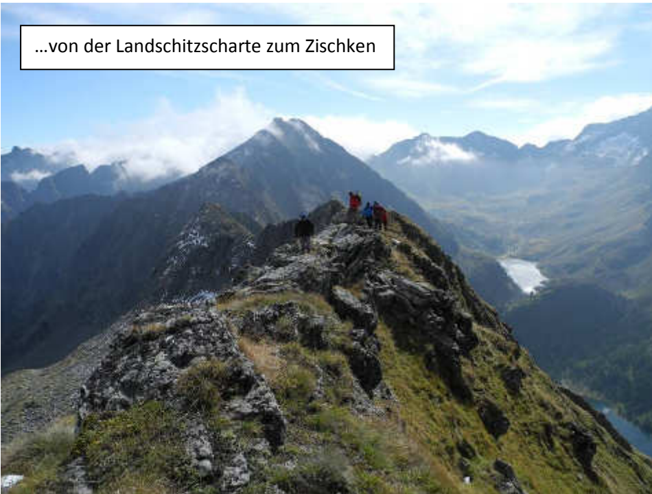
...von der Landschitzscharte zum Zischken